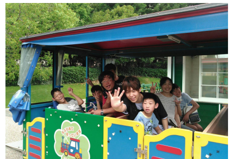
デンパーク遠足・メルヘン号

「元気だね～」と手を振り「ドラマの場面みたいだね。」と 盛り上がりました。周遊中にメルヘン号から手を振ると、園内の お客さんが振りかえしてくれます。