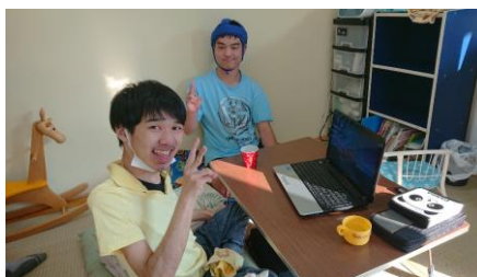
パソコンで映画鑑賞