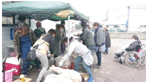
おひろめ会での豚汁の炊き出し