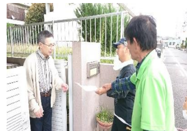
市長さんやご近所さんに。